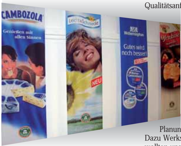
Banner von einigen Produkten des Unternehmens

Die Käserei Champignon hat den Anspruch, in ihrem Segment führend zu sein hinsichtlich Technologie, Qualität, Sicherheit und Produktivität. Bekannte Marken wie Cambozola, Rougette und Champignon Camembert gehören zum Sortiment. Bei der Herstellung der Weichkäsespezialitäten spielt die Hygiene eine gehobene Rolle, deren permanente Verbesserung ein Daueranliegen der Werksleitung ist.