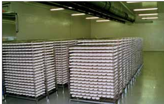
Besonders wichtig ist, dass in den Reiferaum keine Fremdkeime verschleppt werden

re Produkte ist nicht gegeben. Das haben wir von einem akkre-