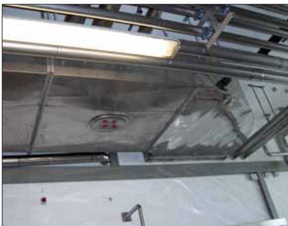
Nach dem aktuellen Stand der Technik verlegte Lüftungsschächte

dierten externen Labor sensorisch und rückstandsanalytisch überprüfen lassen. Auch unsere Mitarbeiter empfinden die Umgebungsluft jetzt als deutlich angenehmer.“ Die Ausbringungsmenge an Entkeimungsmittel ist auch äußerst gering: 15 Liter pro Monat werden benötigt für eine Behandlung von ca. 10.000 m 3 umbauten Raum. „Dieser geringe Verbrauch hat uns ehrlich gesagt verblüfft“, bemerkt Etzlinger immer noch erstaunt darüber. „Wir hatten ursprünglich mit deutlich mehr Mitteleinsatz gerechnet und sind deshalb sehr zufrieden mit dem erreichten Kosten-Nutzen-Verhältnis. Zudem ist der Wirkstoff für die Mitarbeiter völlig unbedenklich. Es gibt entsprechende Zertifikate zur Humanverträglichkeit.“ Ein weiterer Schritt zur Hygieneabsicherung war das Abdichten der Ritzen an den Türen der Lüftungsanlage mit einfachem Klebeband, damit dort keine unerwünschte