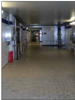
Dieser komplette Flurbereich wird von der entkeimten Luft durchströmt

mierung vorgestellt und in einem ganzheitlichen Lösungskonzept aufgezeigt. Besonders hoch war dabei der betriebsinterne Umsetzungsfaktor. Mit relativ einfachen