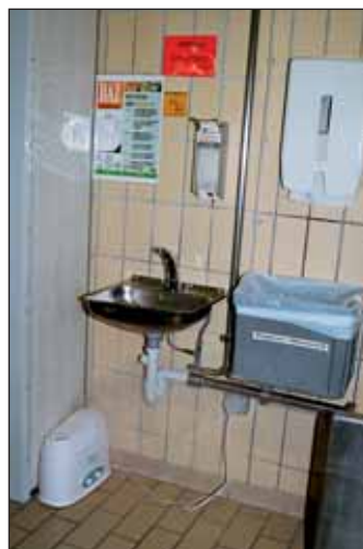
In dieser sensiblen Personalhygieneecke steht zur Sicherheit ein kleines zusätzliches Luftentkeimungsgerät (unten links)