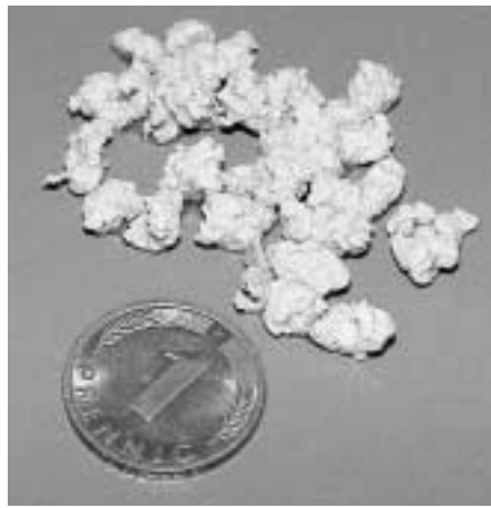
2: Bei den Rohstoffkomponenten zur Herstellung des Füllstoffes handelt es sich vor allem um Produkte aus dem „gelben Sack“. Ein spezielles Hochdruckextrusionsverfahren ermöglicht die homogene Verbindung der unterschiedlichen Füllstoffkomponenten

Bei dem neuen BioWAb-Verfahren wird ein neuentwickelter Füllstoff mit der Bezeichnung „Microfun“ (Bild 2) aus wiederverwerteten Kunststoffen, Zellulose und Mineralien eingesetzt, der neben der Unverrottbarkeit die Vorteile einer mehrfach größeren Oberfläche (innere und äußere) als auch die Möglichkeit einer unbeschädigten Zwangsförderung bietet. Bei den einzelnen Rohstoffkomponenten zur Herstellung des Füllstoffes handelt es sich in erster Linie um Produkte aus dem „gelben